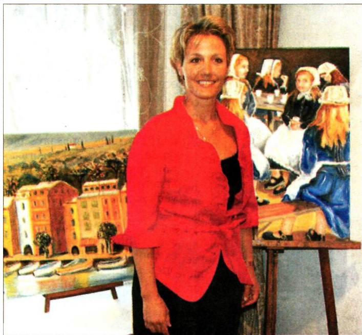
L'artiste entre Portofino et le goûter des petites Bretonnes.