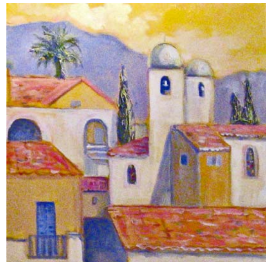
Rita Mancesti, Mosaïque corse (détail), huile sur toile, 100 x 100 cm, 2010

Techniques et iconographies des œuvres de Rita Mancesti et de Catherine Claude n'ont absolument rien en commun. Pourtant, les deux artistes partagent l'amour de la nature ; chacune crée et défend par le biais de son art, une vision de la nature indispensable à l'humain, tout citadin savant et sophistiqué soit-il. Rita Mancesti suit la voie des peintres du XIXe siècle, assoiffés de contemplation de la lumière, de la couleur et